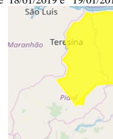
Fig 2: Áreas com aviso de atenção.